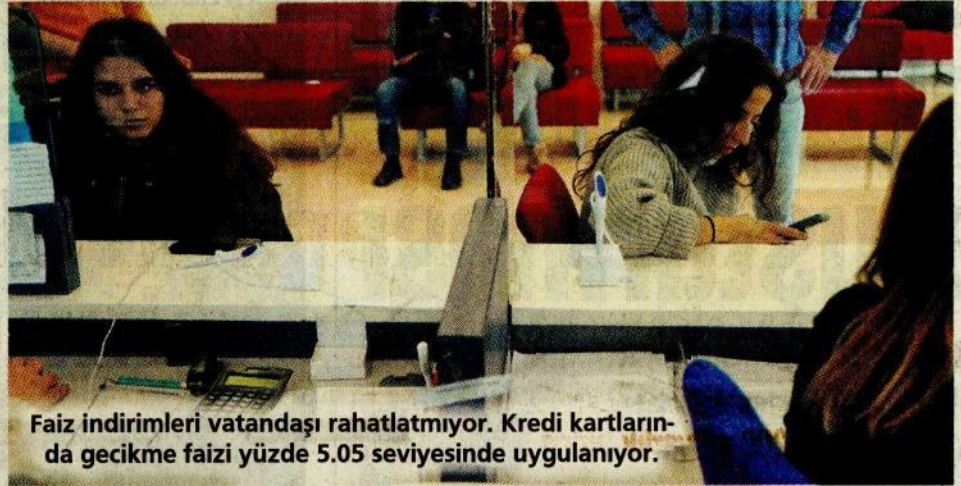
Faiz indirimleri vatandaşı rahatlatmıyor. Kredi kartlarında gecikme faizi yüzde 5.05 seviyesinde uygulanıyor.

Merkez Bankası'nın son faiz indirimi TL mevduat faizlerinde 3 puanlık düşüşe yol açarken, tüketici ve ticari kredi faizlerine ise yansımaları görülmedi. Vatandaş zorunlu ihtiyacını karşılamak için faize bakmadan, kredi kartı ve ihtiyaç kredisi kullanırken, bankalar ise hem büyüme sınırını hem de takipteki kredilerdeki artış dolayısıyla faizleri indirmeye istekli görünmüyor. Nitekim yüksek faiz ortamında nefes alamaz ha-